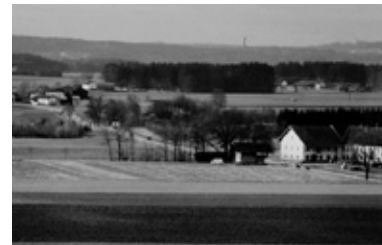
Das Staudhamer Feld in Blickrichtung (Nordwesten) des Guts Staudham, vor Errichtung des Gewerbegebietes, ca. 1995

Der sinnstiftende Name erinnert an den alten Flurnamen Staudhamer Feld, der in den einschlägigen historischen Kartenwerken etwas südlich des heutigen Straßenverlaufs – zwischen der