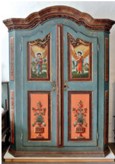
Bauernschrank, geschnitzt, bemalt, 1831. Museum Wasserburg

Das Bild des Hirten war auch den Menschen hierzulande geläufig und Teil der Lebensrealität. Die Schäferdichtung der Renaissance und des Barock idealisierte das Leben der Hirten und machte es zum Sujet der bildenden Kunst. Im 18. Jahrhundert wurde auch Maria als Gute Hirtin vereinzelt dargestellt. In der Oberbayerischen Volkskunst, für die die Marienverehrung von großer Bedeutung war, wurde dieses Motiv sehr beliebt.